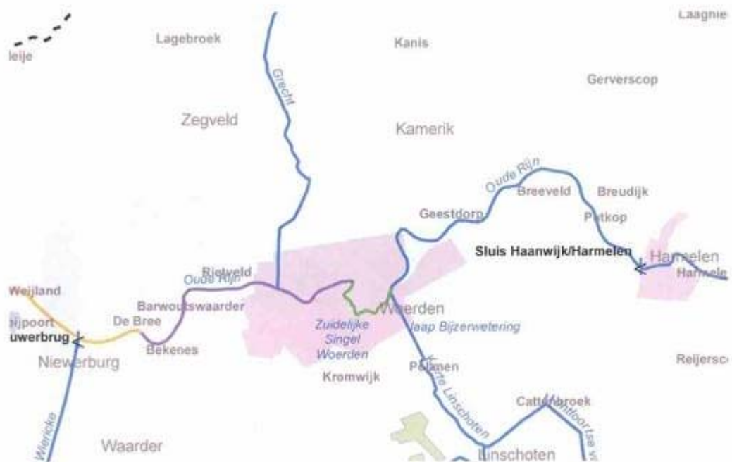
Kaart 1. Samenloop van Rijn, Grecht, Wiericke en Linschoten